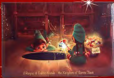
Il Regno di Babbo Natale - the Kingdoms of Santa Claus