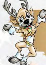
LAMPO LA RENNA