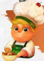
BON BON ELFETTO PASTICCIERE