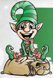
BUDDY 100% ELFETTO