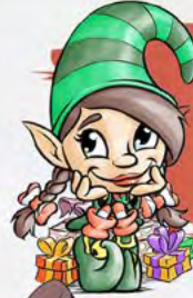
PRETTY 100% ELFETTA